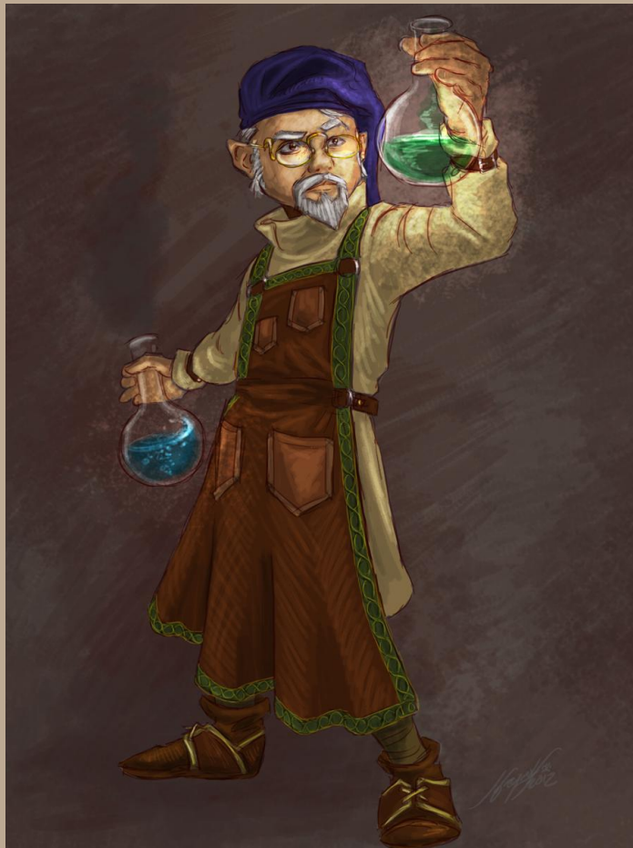
Peinture : 'La science de l'art'

Autoportrait du Gnome, Kasseulbury Illustregens, Maître peintre réalisant de nouvelles couleurs pour ses futurs chef d'oeuvres.