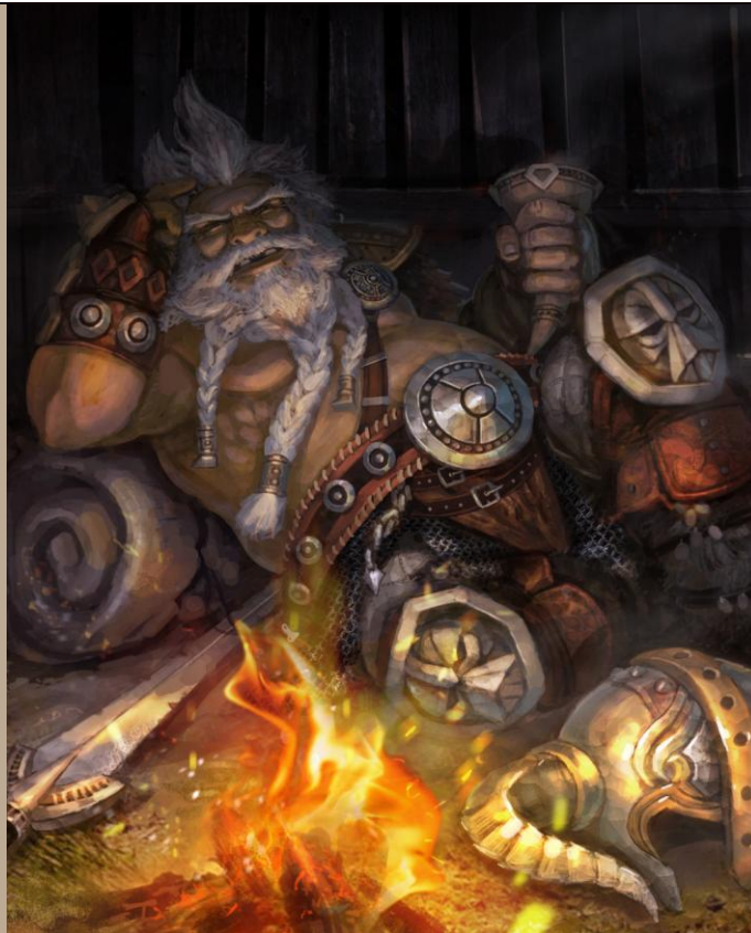
Peinture : 'L'ivresse au combat'

Représentation du nain, Griwoëfgaär Millechopes festoyant devant un bon feu de camp autour des restes d'armures des guerriers qui viennent de tomber sous ses coups de poings.