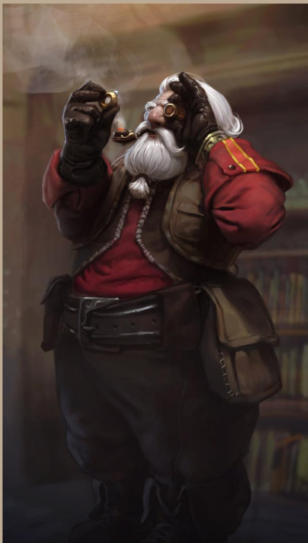
Peinture : 'Et le nain créa'

Illustration de l'orfèvre nain, Drödd Maindor contemplant sa dernière œuvre, la chevalière de Moradin.